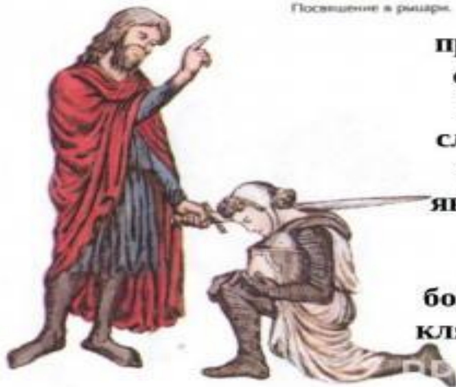
Посвящение в рыцари.

преданность сеньору и верность слову (лишь трусость является для рыцаря позором большим, чем клятвопреступ ление)