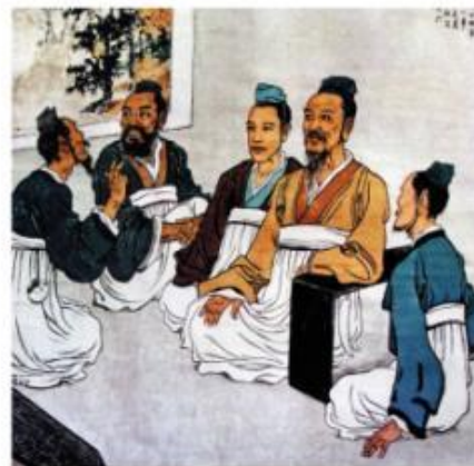
Конфуций с учениками

Китайский философ Конфуций, когда его спросили, есть ли такое слово, которое одно выражало бы моральный закон всей жизни, ответил: «Разве не «взаимность» это слово? Чего не хочешь для себя — не делай другим».